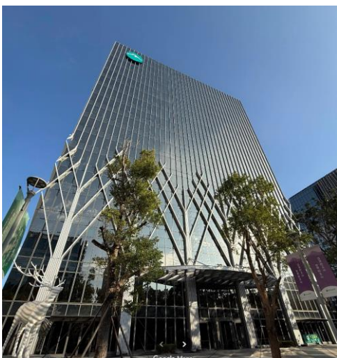
【玉山銀行第二本店ビル外観】